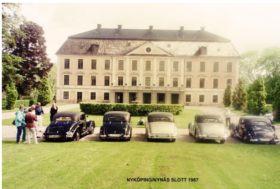
NYKÖPING/NYNÄS SLOTT 1987