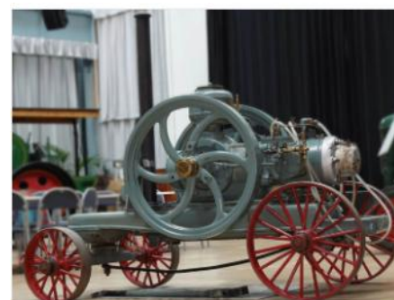
Bolinder's Colombiamotor, 1910 för drift av tröskverk