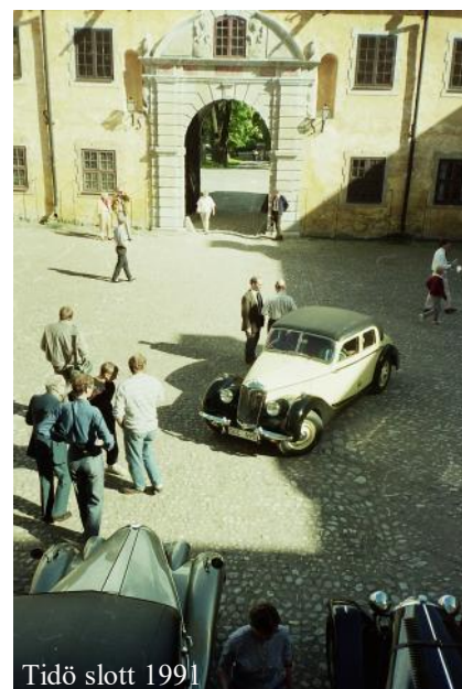
Tidö slott 1991