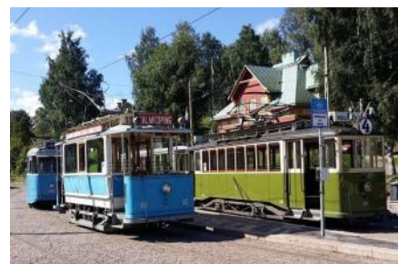
Kvitto eller övergång? frågade alltid konduktören på 4:an