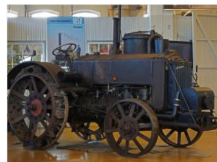
Munktell GBM 2, 1942 gengastraktor